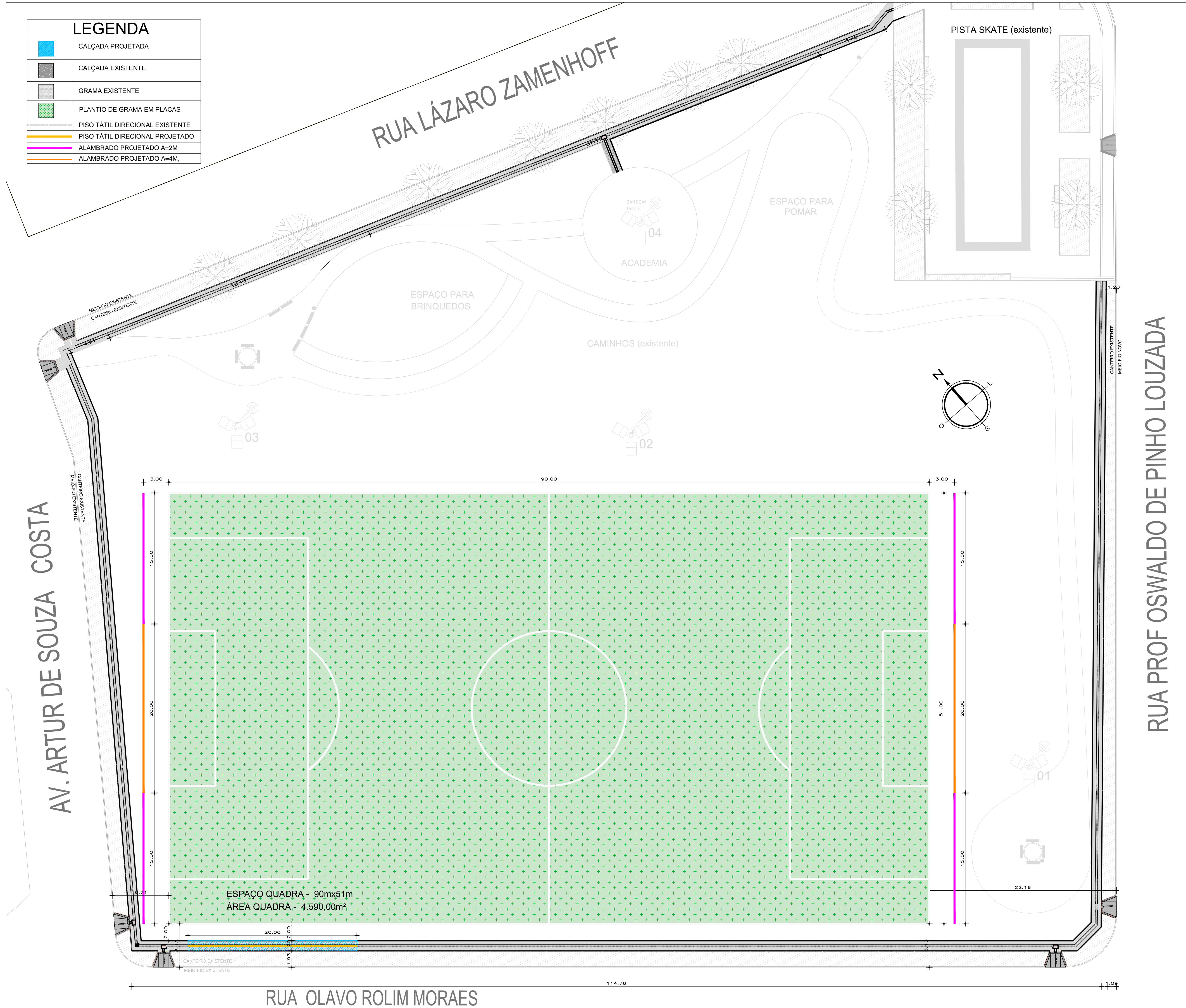
02 | PLANTA BAIXA DO CAMPO SÃO JORGE ESCALA 1:250